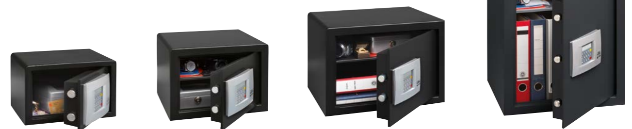
P 1 E